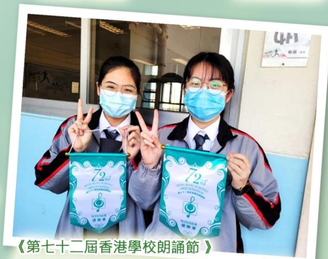
《第七十二屆香港學校朗誦節》 二人粵語朗誦：第一名「人生在途·如客在船」