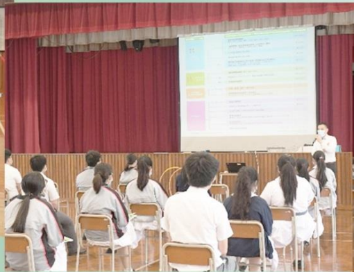
學校為同學們舉辦升學講座