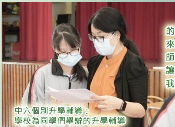
中六個別升學輔導：學校為同學們舉辦的升學輔導

我的個別輔導老師為我選科的方向提供了寶貴的意見，對我來說有莫大幫助。不僅於此，老師還分享她在大學生活的趣事，讓我對大學有更多的憧憬，成為我更加努力學習的原動力。