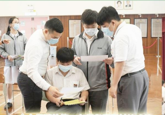
中六模擬放榜：老師與同學討論成績