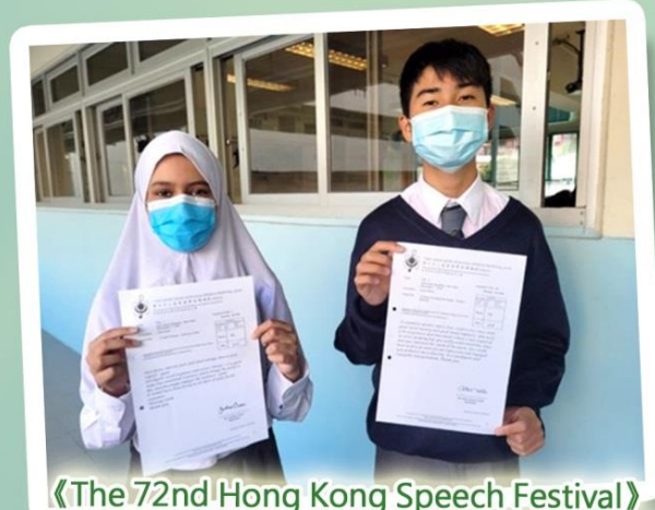
《The 72nd Hong Kong Speech Festival》

「寫得很好的一篇小說，描寫具體，細節豐富動人。主題並無甚麼微言大義，愛美是人的天性，但世俗卻另有偏見，或說歧視。故事好在不議論。結句見反思：視線聚焦了，又散落了，我在窗上看到了自己。提升了內容的境界。佳作。」