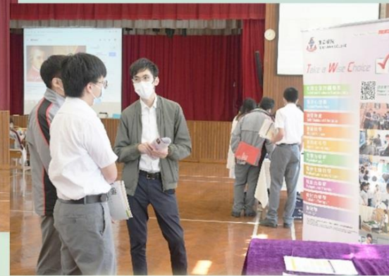
邀請大專院校作升學簡介

「認受性」一直是很多人對台灣升學的擔憂，我亦不例外。今次的台灣升學講座令我不再擔憂台灣升學的認受性，也讓我了解台灣的升學制度。我現已着手預備個人申請的資料，很希望能成功升讀時尚設計學系。