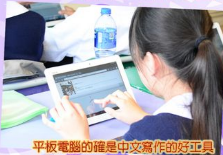
平板電腦的確是中文寫作的好工具