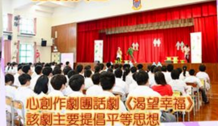
心創作劇團話劇《渴望幸福》 該劇主要提倡平等思想