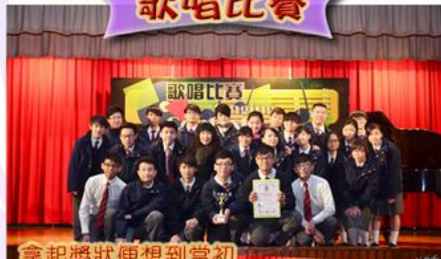
拿起獎狀便想到當初的努力沒有白費