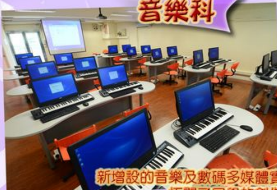
新增設的音樂及數碼多媒體實驗室拓闊了同學的創作空間