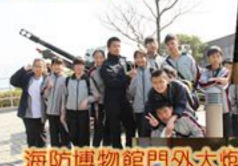
海防博物館門外大炮