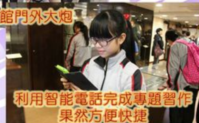
利用智能電話完成專題習作果然方便快捷