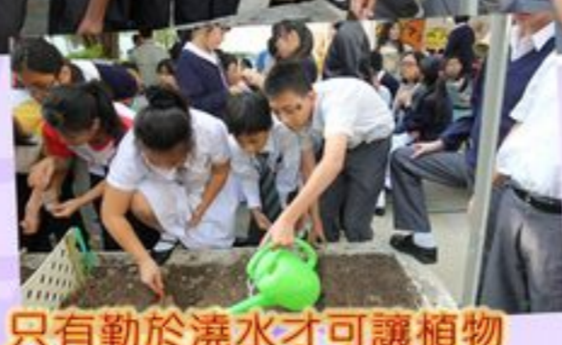
只有勤於澆水才可讓植物 茁壯生長