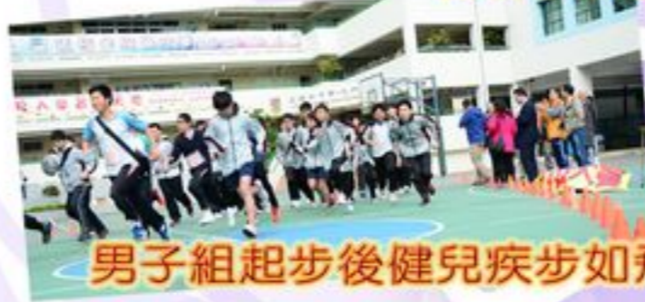
男子組起步後健兒疾步如飛