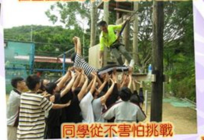
同學從不害怕挑戰