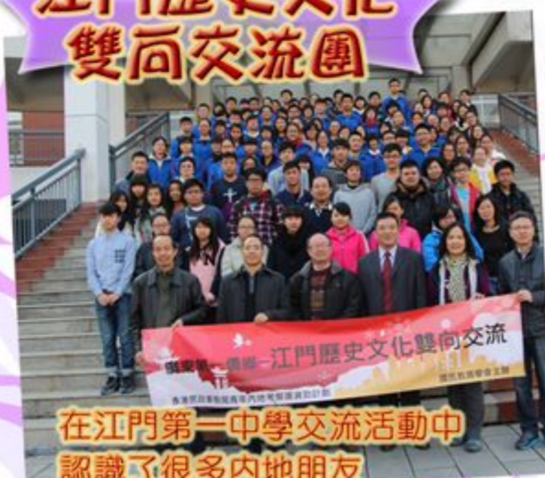
在江門第一中學交流活動中認識了很多內地朋友