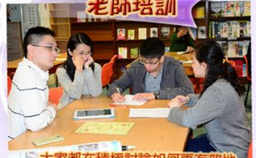
大家都在積極討論如何更有效地把平板電腦運用於課堂上