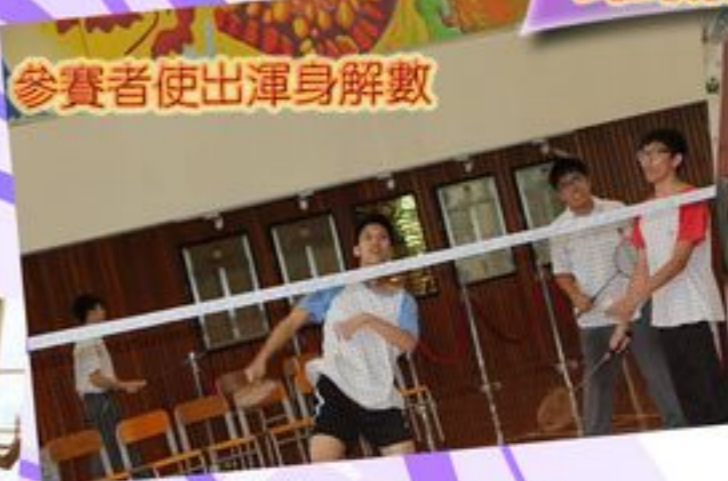
參賽者使出渾身解數