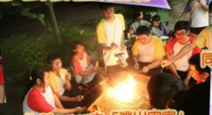
Halloween之「逃出密室」活動後大伙兒一起燒烤