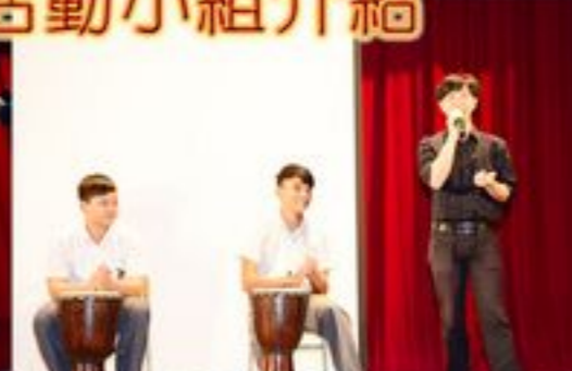
另類的敲擊樂器—非洲鼓