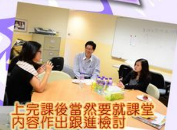
上完課後當然要就課堂 內容作出跟進檢討