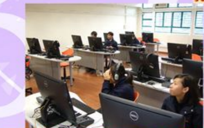
電腦使音樂課學習興趣大大增加