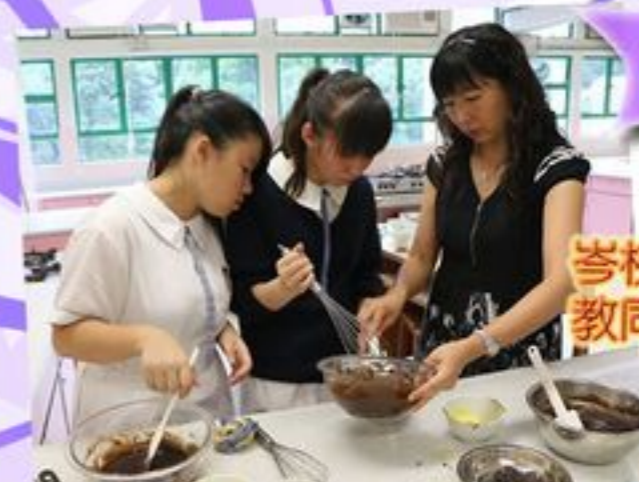
岑校長親自示範教同學如何製作心太軟