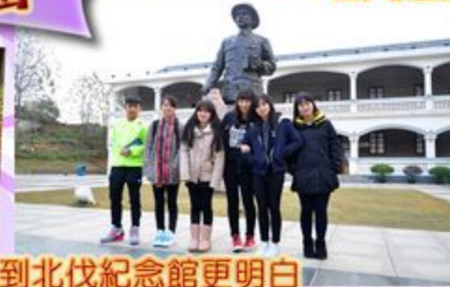
來到北伐紀念館更明白孫中山先生北伐所遇到的困難