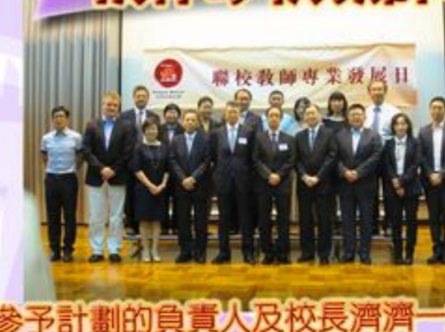
參予計劃的負責人及校長濟濟一堂