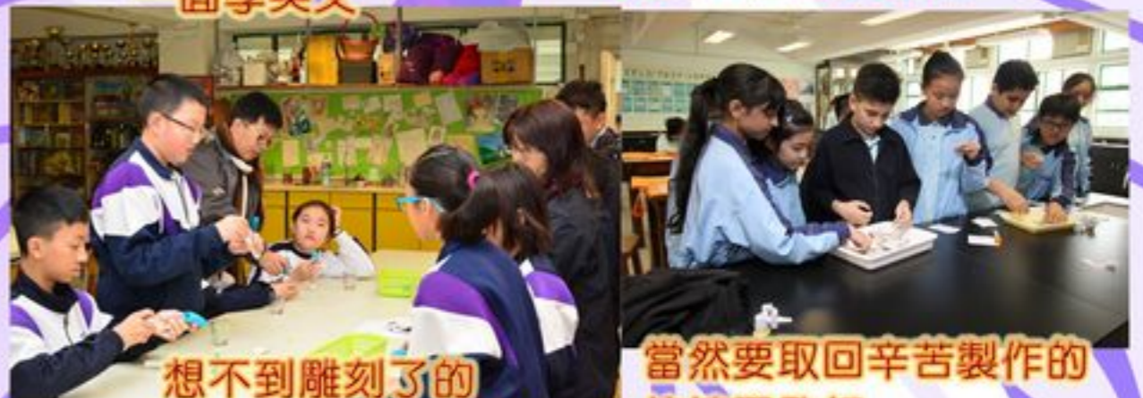
想不到雕刻了的 玻璃杯是那麼精美