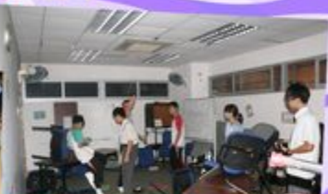
同學在努力尋找鎖匙的去向