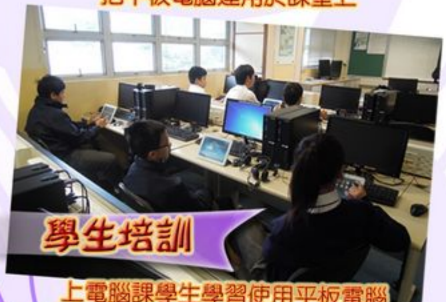
上電腦課學生學習使用平板電腦