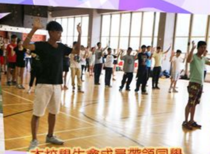
本校學生會成員帶領同學在三校聯校營中跳舞