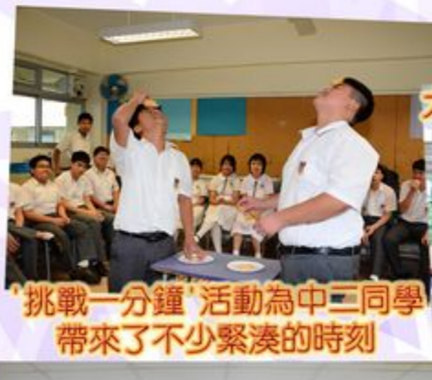
'挑戰一分鐘'活動為中三同學帶來了不少緊湊的時刻