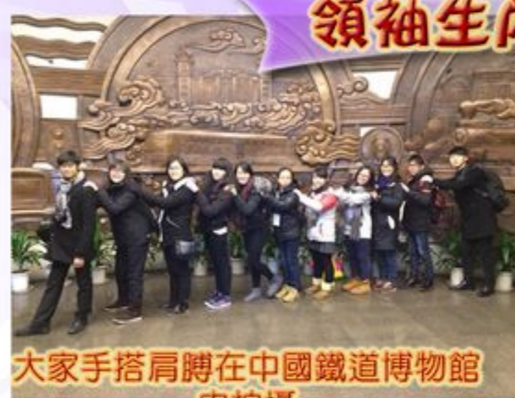
大家手搭肩膀在中國鐵道博物館內拍攝