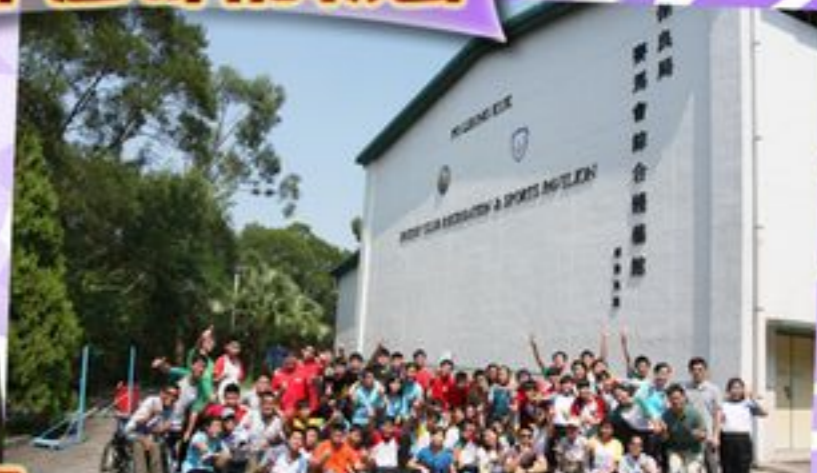
中一中二同學在保良局大棠度假村來一張大合照