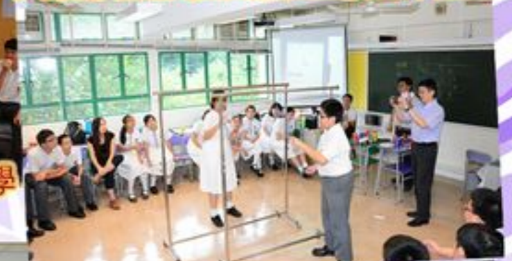
看誰人可以掛得最多衣架 誰人便是優勝者