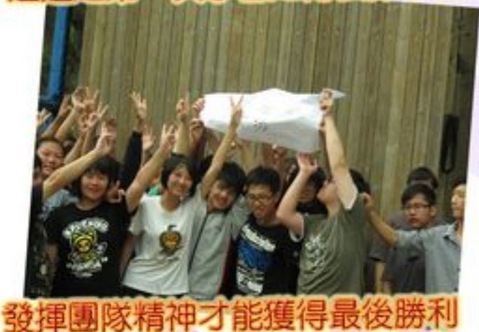
發揮團隊精神才能獲得最後勝利