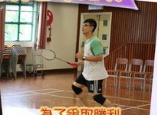
為了爭取勝利同學拿出拼搏的精神