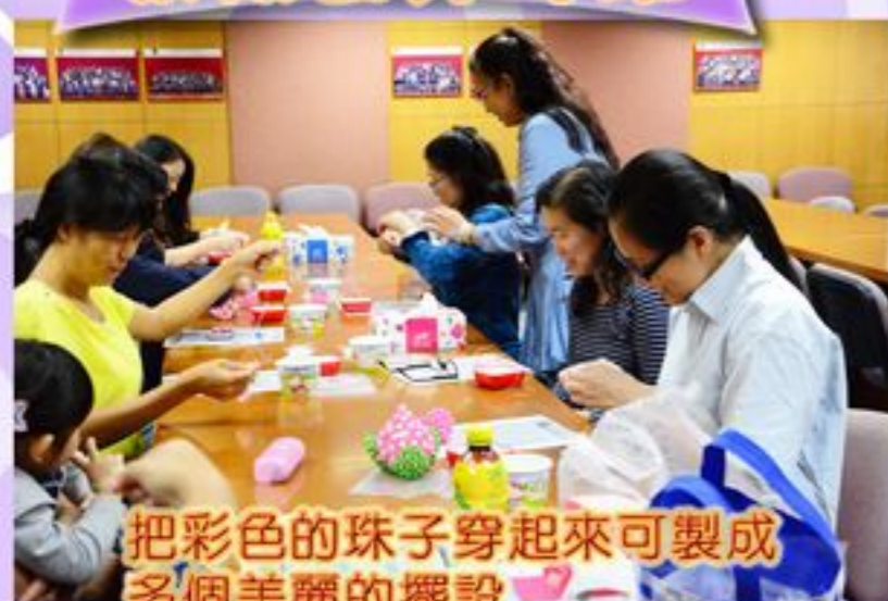
把彩色的珠子穿起來可製成 多個美麗的擺設