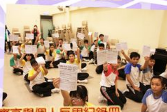
齊高舉個人反思紀錄冊