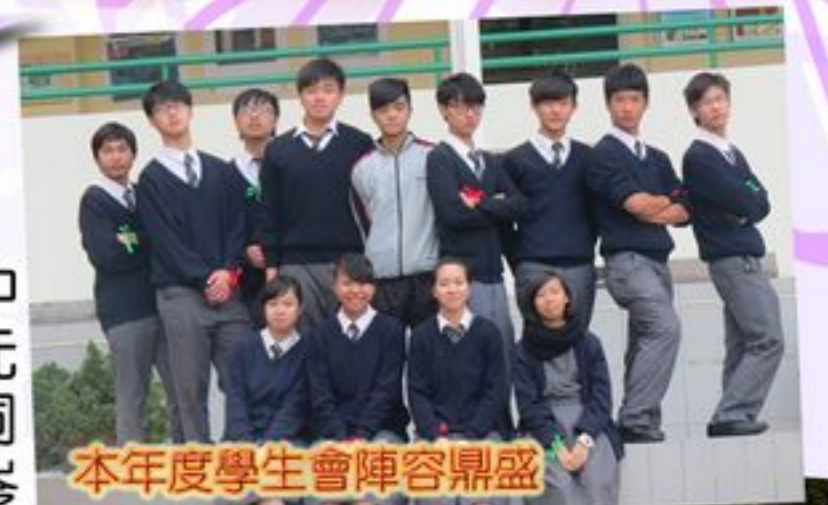
本年度學生會陣容鼎盛