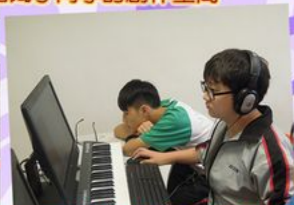
電腦更可用來作曲呢