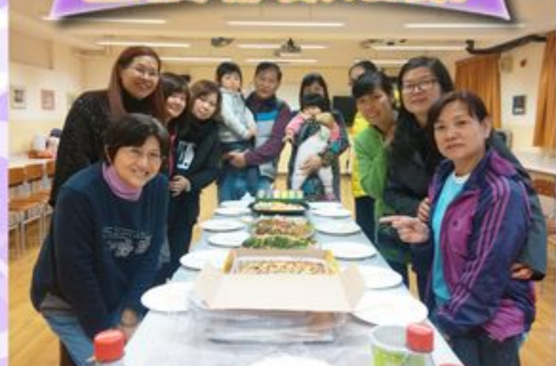
在普天同慶的聖誕節不忘歡聚一番