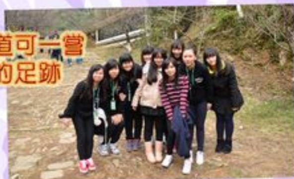
在梅關古道可一嘗古人走過的足跡