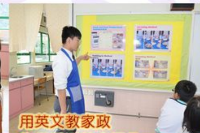
用英文教家政 先要重溫英文詞彙