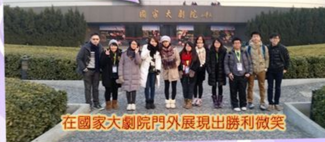
在國家大劇院門外展現出勝利微笑