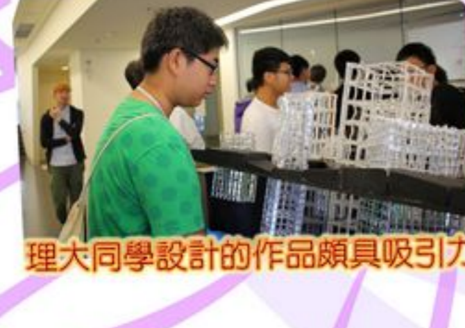
理大同學設計的作品頗具吸引力