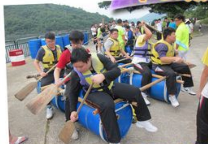
這還是第一次學會如何製作木筏