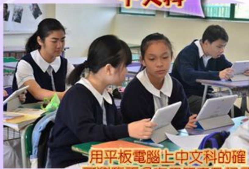
用平板電腦上中文科的確可瀏覽更多有用篇章及詞彙