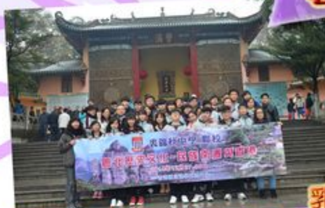
在南華寺參觀更瞭解佛教在中國發展的歷史