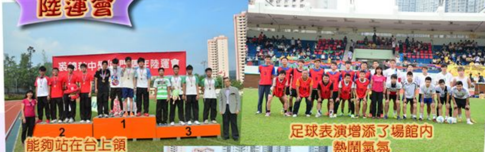
能夠站在台上領獎當然感到高興