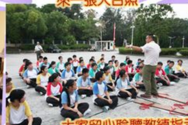
大家留心聆聽教練指示