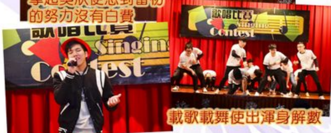
載歌載舞使出渾身解數