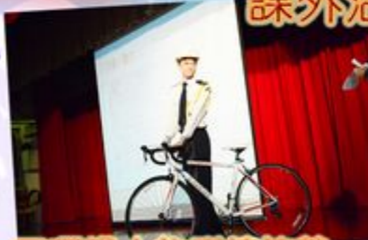
三項鐵人的訓練培養 同學自信及毅力