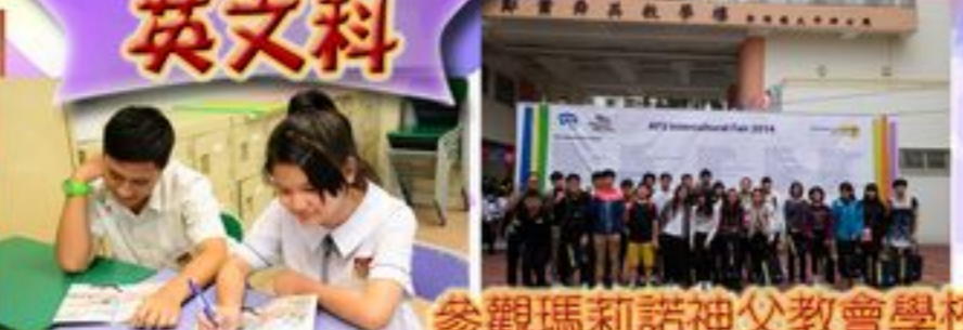
吃完午飯後大家 快來學習英文吧