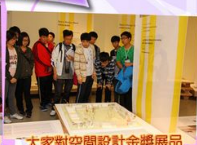
大家對空間設計金獎展品投下讚歎的目光