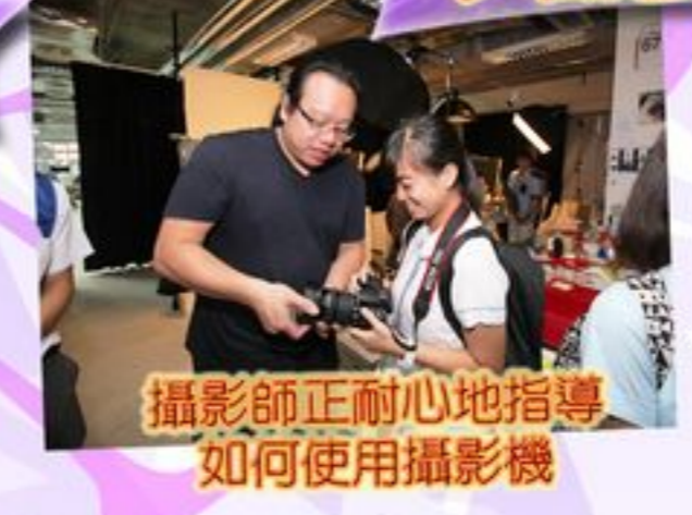
攝影師正耐心地指導如何使用攝影機