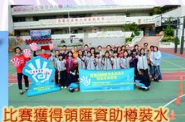
比賽獲得領匯資助樽裝水