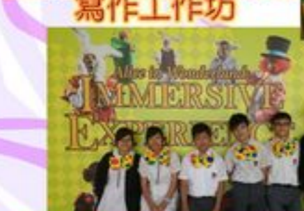
中四級同學參予由語常會舉辦的活動 並學了不少英語