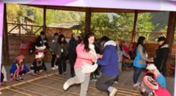
乳源必背瑤寨的竹舞吸引了岑校長和同學一起參予