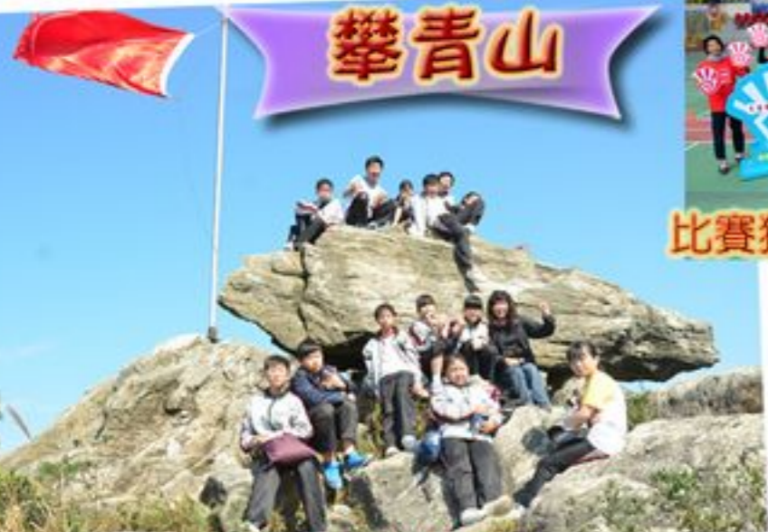
能夠攀上青山山頂同學體驗了堅毅精神