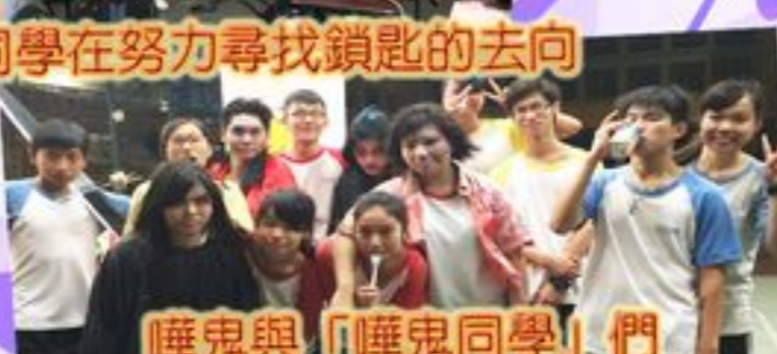
嘩鬼與「嘩鬼同學」們