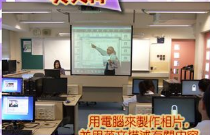
用電腦來製作相片，並用英文描述有關內容