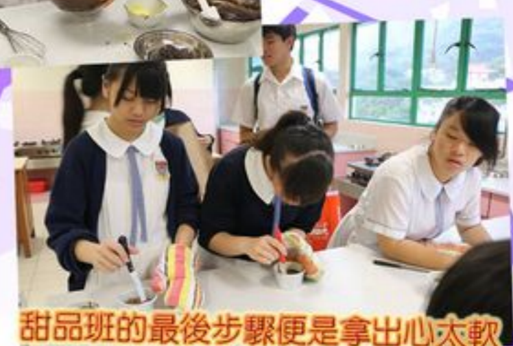
甜品班的最後步驟便是拿出心太軟