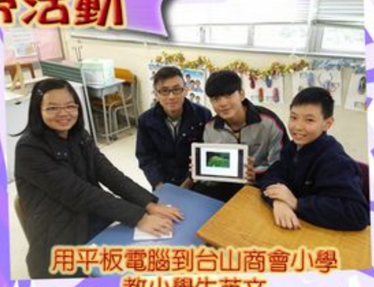
用平板電腦到台山商會小學教小學生英文