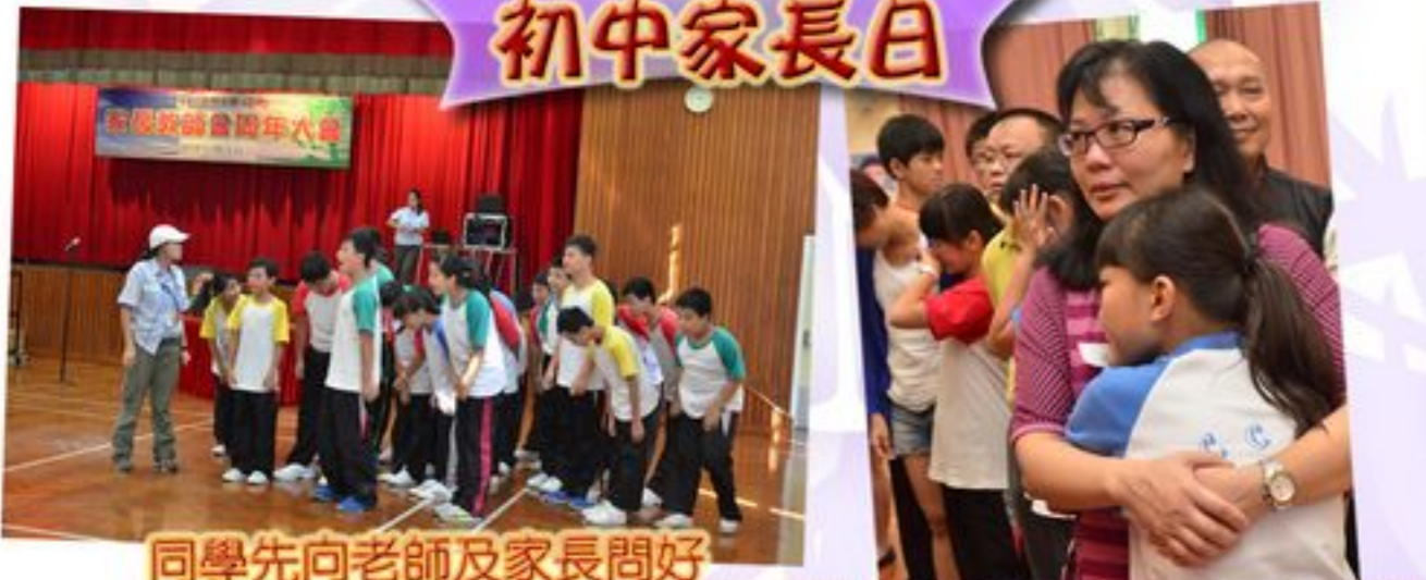
同學先向老師及家長問好