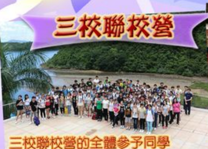
三校聯校營的全體參予同學來一張大合照