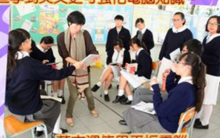
英文週使用平板電腦