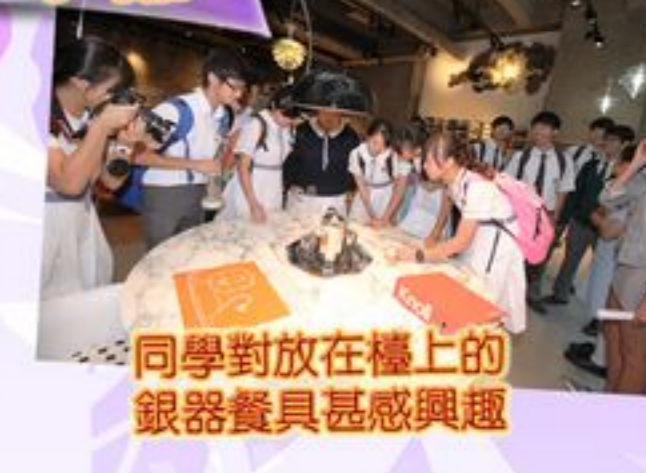
同學對放在檯上的銀器餐具甚感興趣