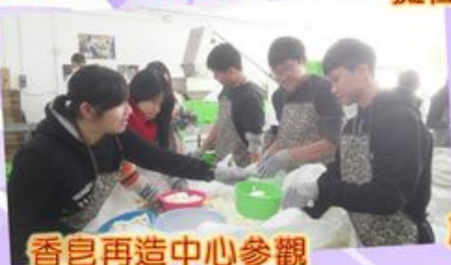
香皂再造中心參觀