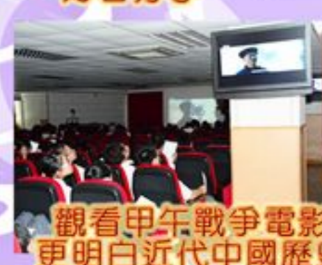
觀看甲午戰爭電影 更明白近代中國歷史