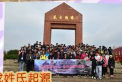
珠璣古巷可尋找姓氏起源