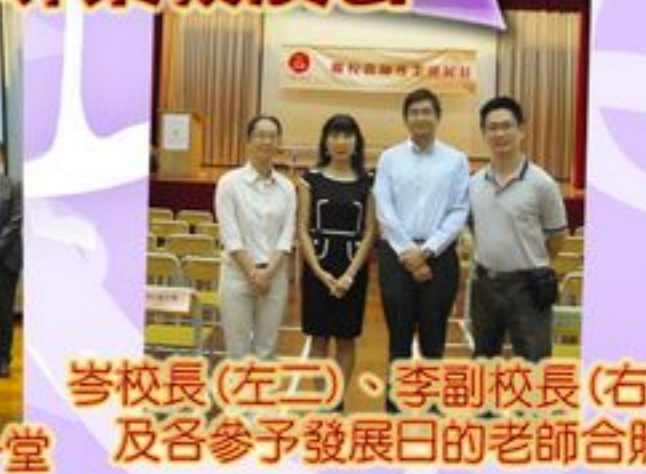
岑校長(左二)、李副校長(右二)及各參予發展日的老師合照