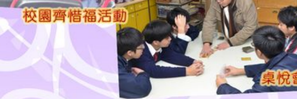
桌悅會友桌遊小組