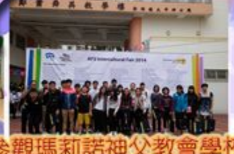
參觀瑪利諾神父教會學校