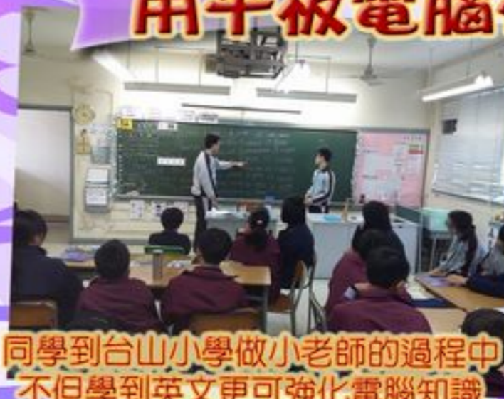
同學到台山小學做小老師的過程中不但學到英文更可強化電腦知識