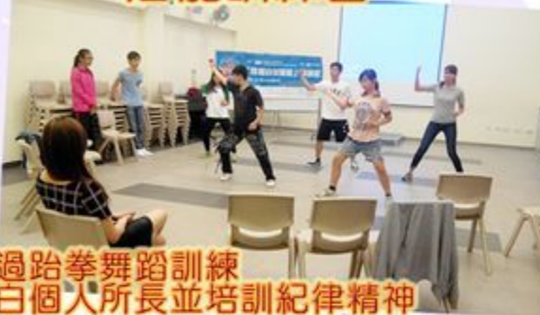
透過跆拳道舞蹈訓練 明白個人所長並培訓紀律精神