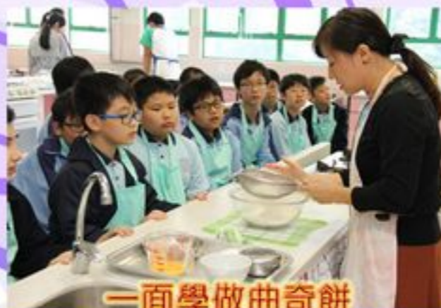
一面學做曲奇餅 一面學英文