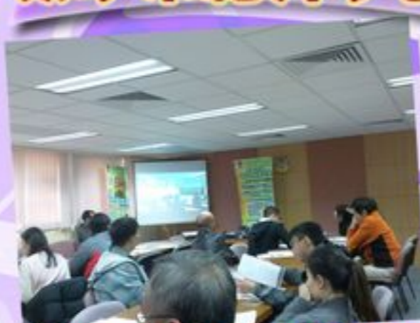
老師在留心觀看中文科的 教學示範影片