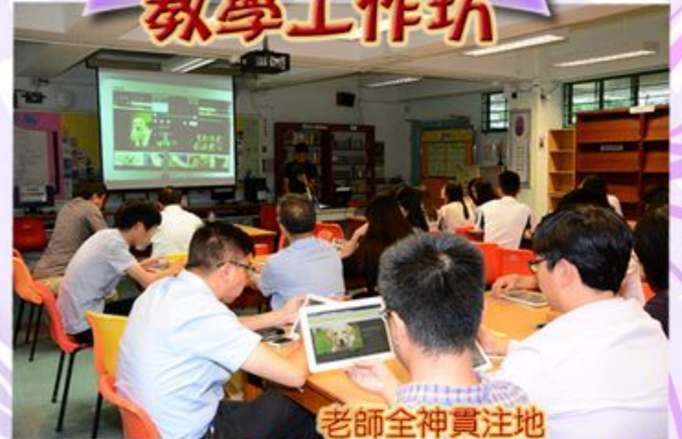
老師全神貫注地學習如何使用平板電腦作網上教學