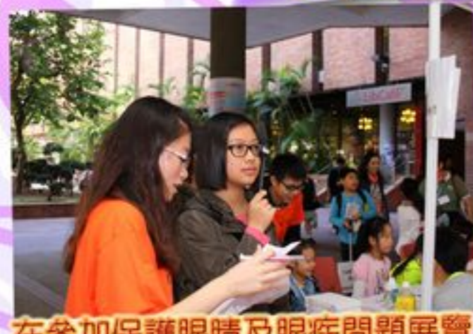
在參加保護眼睛及眼疾問題展覽導賞後不妨來一次視力測試