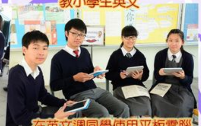
在英文週同學使用平板電腦進行英文聆聽遊戲活動