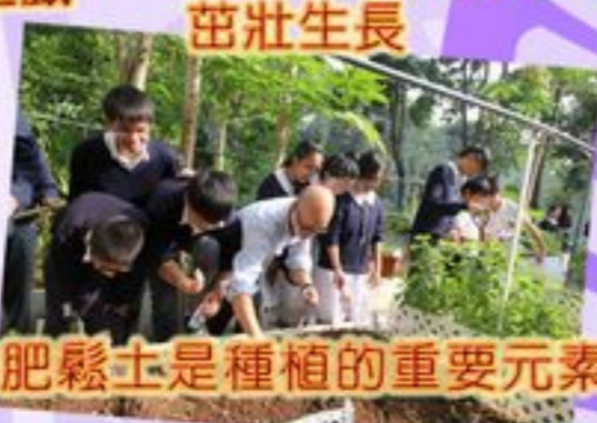
施肥鬆土是種植的重要元素