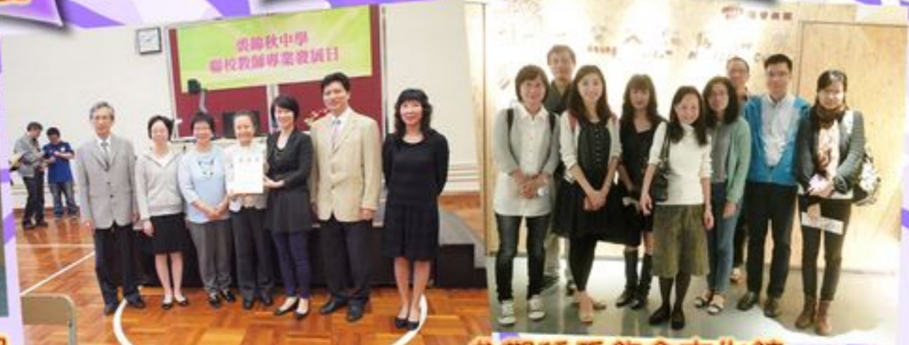
該天探討的主題為 「照顧學習差異」