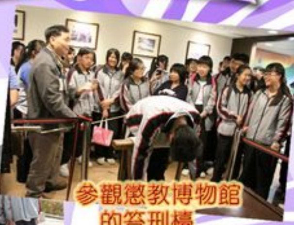
參觀懲教博物館的答刑樓