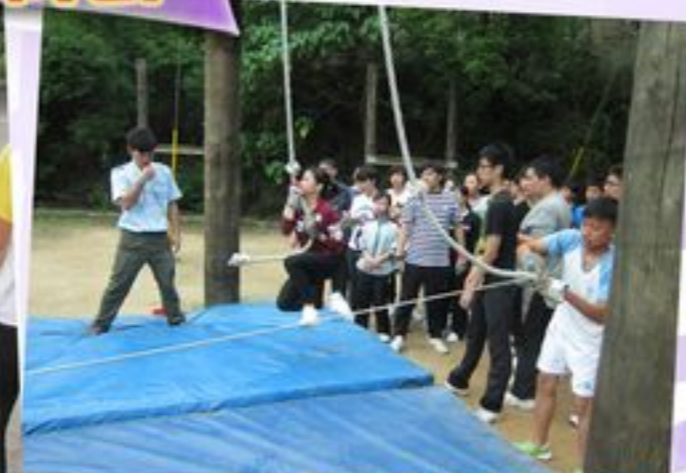
在團體活動中學會協作的重要