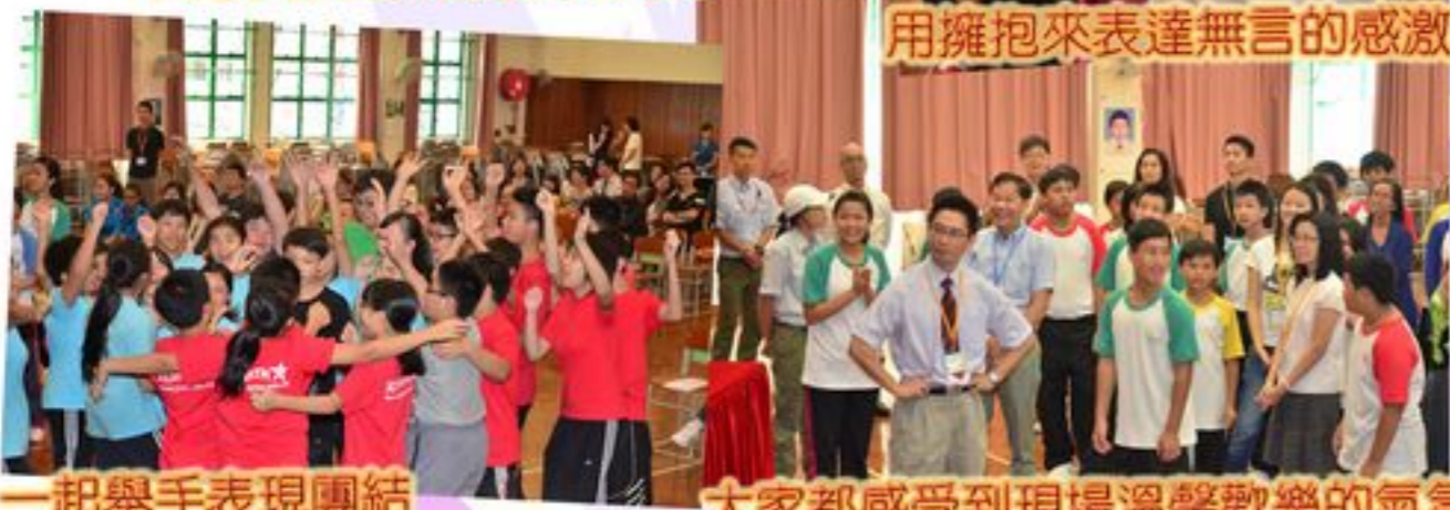
一起舉手表現團結