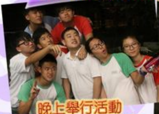
晚上舉行活動增添了一份緊張氣氛