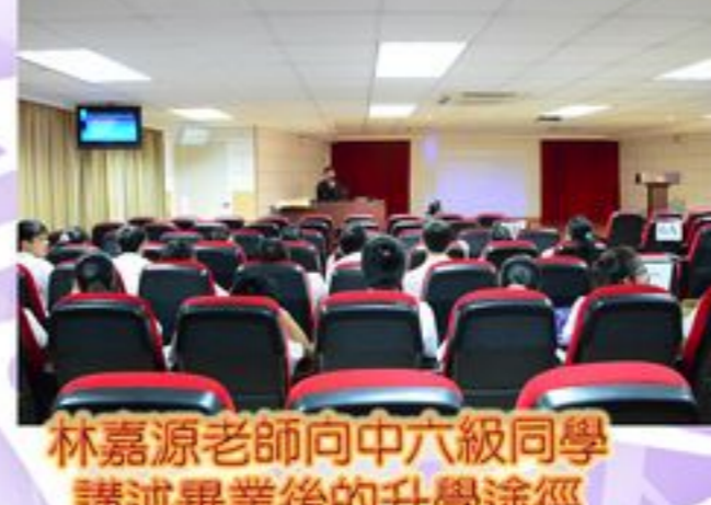
林嘉源老師向中六級同學 講述畢業後的升學途徑