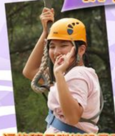
這的確是訓練膽量及冒險精神的好機會