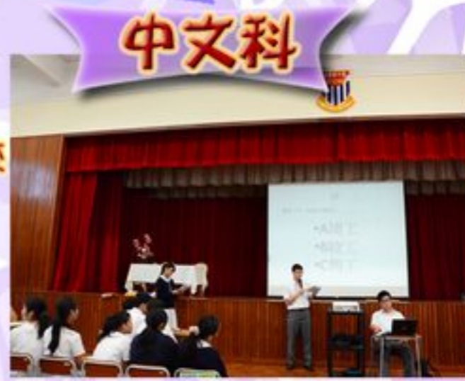
中一二級錯別字比賽